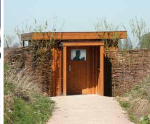
Barrierefreie Beobachtungsstätte der NABU Vogelstation Wedeler Marsch